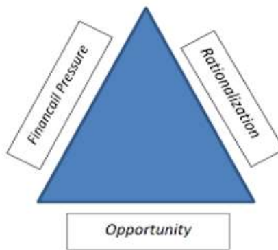
องค์ประกอบของการทุจริต หรือสามเหลี่ยมทุจริต (The Fraud Triangle)

องค์ประกอบหรือปัจจัยที่นำไปสู่การทุจริต ประกอบด้วย Pressure/Incentive หรือ แรงกดดันหรือ แรงจูงใจ Opportunity หรือ โอกาส ซึ่งเกิดจากช่องโหว่ของระบบต่างๆ คุณภาพการควบคุม กำกับควบคุม ภายในของ องค์กรมีจุดอ่อน และ Rationalization หรือ การหาเหตุผลสนับสนุนการกระทำ ตามทฤษฎี สามเหลี่ยมการทุจริต (Fraud Triangle)