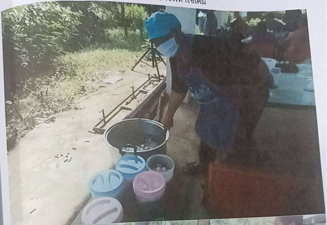
รูปภาพกิจกรรมโครงการส่งเสริมกลุ่มอาชีพพึ่งตนเอง อบต.ชุมพวง การอาชีพทำไข่เค็ม