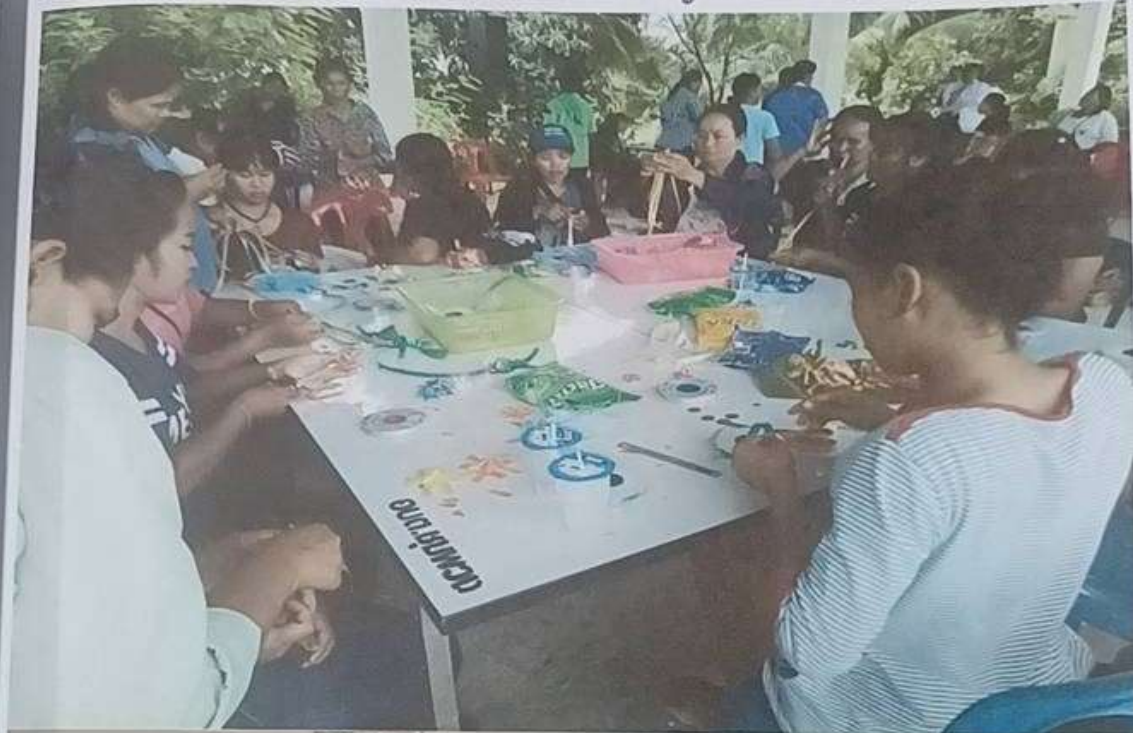
รูปภาพกิจกรรมโครงการส่งเสริมกลุ่มอาชีพพึ่งตนเอง อบต.ชุมพวง การอาชีพทำเหรียญโบราณ